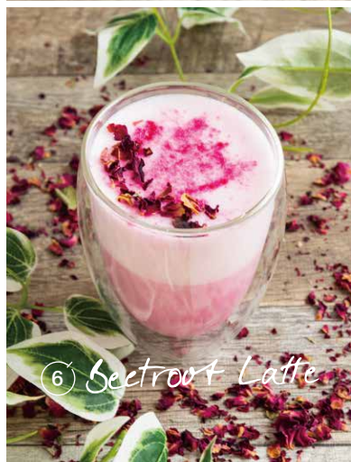
⑥ Beetroot Latte