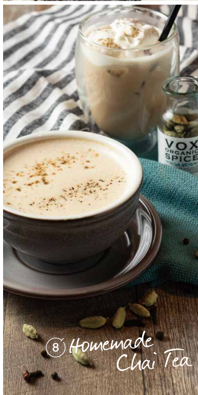
⑧ Homemade Chai Tea