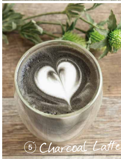
⑤ Charcoal Latte