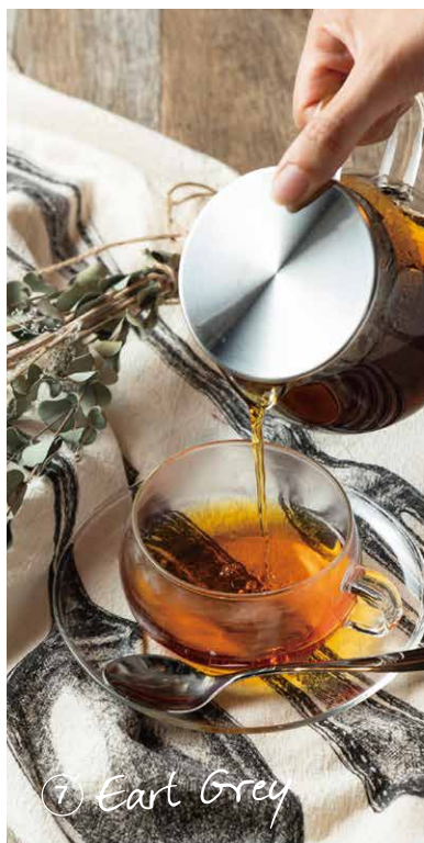
⑦ Earl Grey